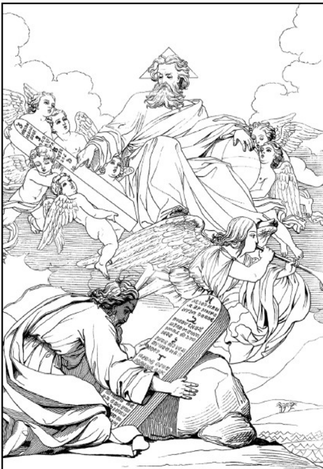
Дарование скрижалей Завета

В пятидесятый день по выходе из Египта евреи были у горы Синай. Вдруг эта гора задымилась и покрылась облаком, засверкала молния, загрелся гром, раздались трубный звук. Когда все стихло, послышался голос Самого Бога: «Аз есмь Господь Бог твой, да не будут тебе бози инии, разве Мене». Господь изрек при этом десять заповедей о любви к Богу и к ближним и велел соблюдать их. Потом Моисей, по повелению Божию, пошел на гору, и Господь дал ему две скрижали, или каменные доски, на которых были написаны десять заповедей. Кроме того, Он дал ему разные другие законы и велел записать и объявить их народу, а также устроить скинию, или переносный храм Божий, – со всеми ее принадлежностями.