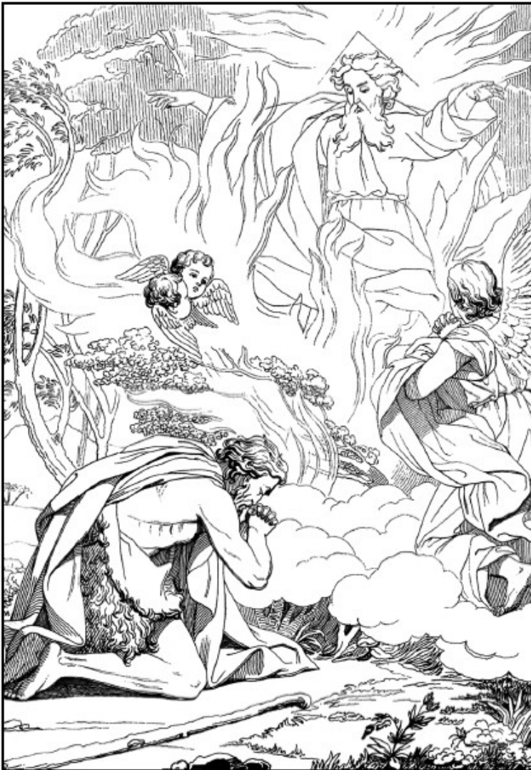
Явление Бога Моисею в неопалимой купине

время их путешествия из Египта в землю Обетованную. Как только они стали выходить из Египта, явился столп, который был во время дня облачным, а ночью огненным, и показывал им путь. На третий день по выходе из Египта евреи подошли к Черному (или Красному) морю и увидели гнавшихся за ними египтян, которые, как и сам фараон, отпустив евреев, так много работавших на них, стали потом сожалеть об этом и хотели воротить их назад. Моисей, по повелению Божию, ударил жезлом своим по морю, вода расступилась, и евреи свободно перешли на другой берег по дну морскому. Египтяне думали, что и они перейдут, и пошли также по дну моря. Но Моисей опять ударил своим жезлом по воде, и она слилась и затопила египтян.