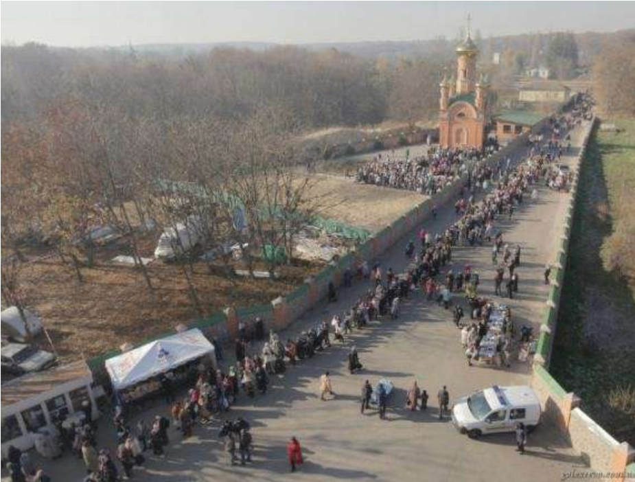
Очередь в усыпальницу матушки Алипии

сотни тысяч человек, не меньше, и это не преувеличение. Это и является доказательством ее угодности перед Богом.